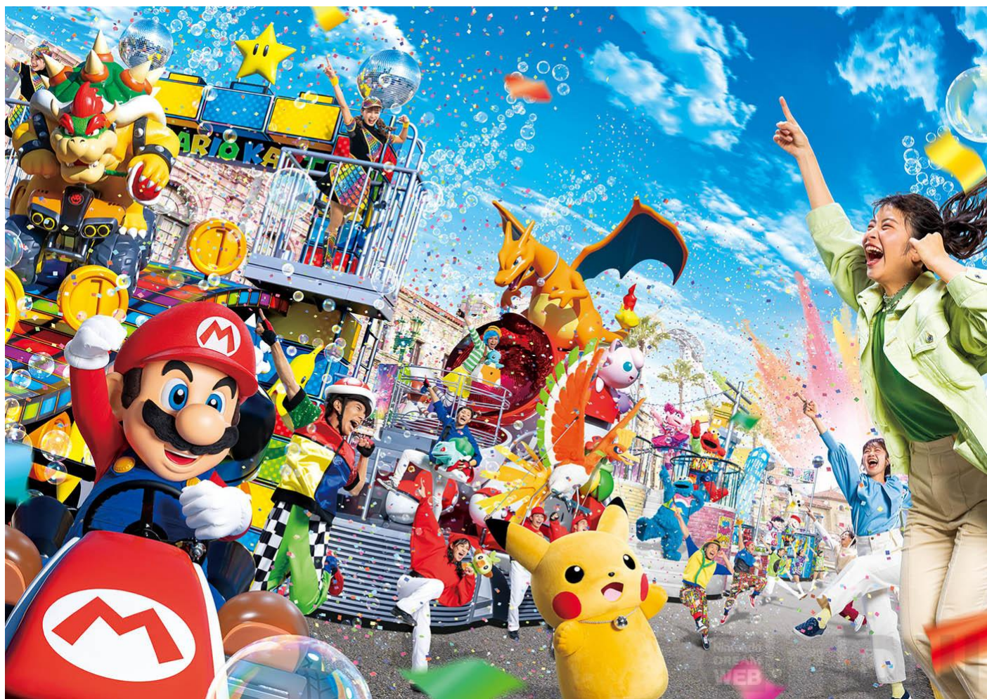
(以下航班時間&接駁時刻等，僅提供參考，實際請以出發日航班為主)