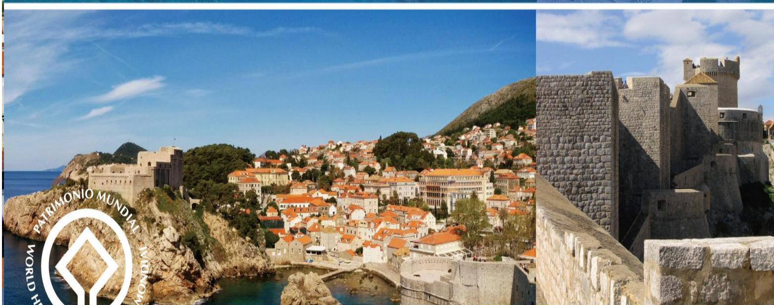
杜布羅尼克 1979 DUBROVNIK