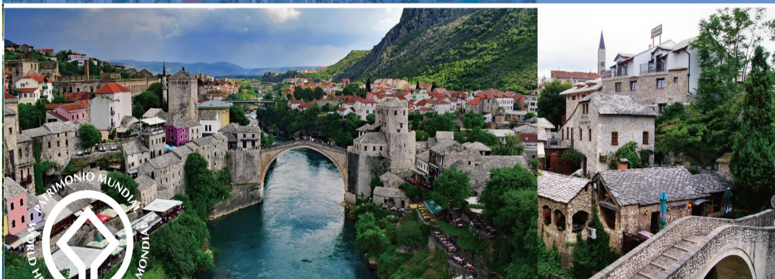
慕絲塔-老橋 2005 MOSTAR