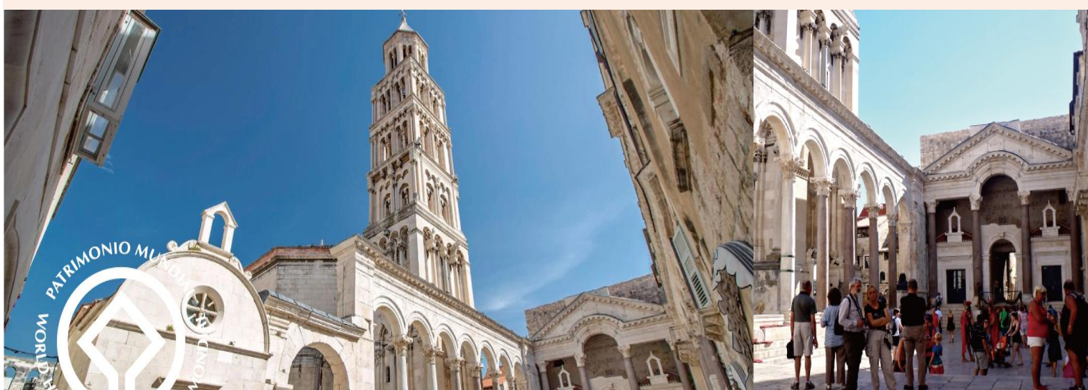
斯普利特-斯普利特主教座堂 1979 SPLIT